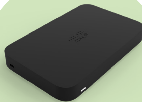
Meraki Z Series