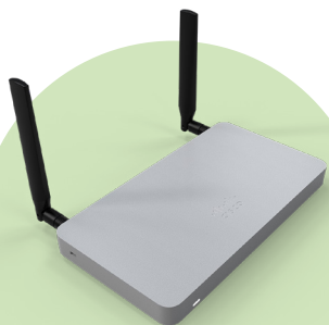
Meraki MX Series